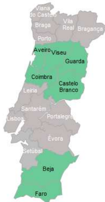
Figura 1. Área de abrangência geográfica afectada a cada CR (áreas assinaladas a verde).